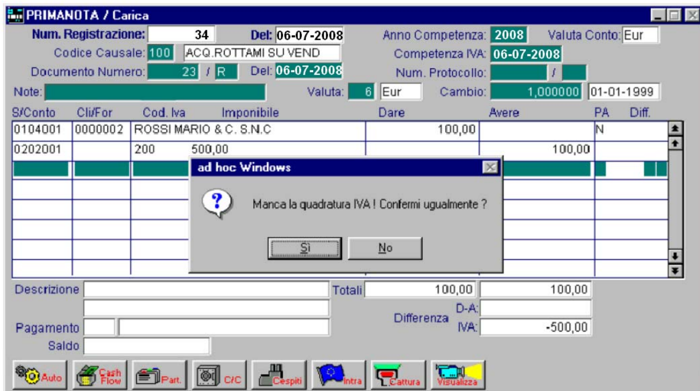
Fig. 2.132 -Registrazione fattura acquisto materiale da rottame nel reg.iva vendite